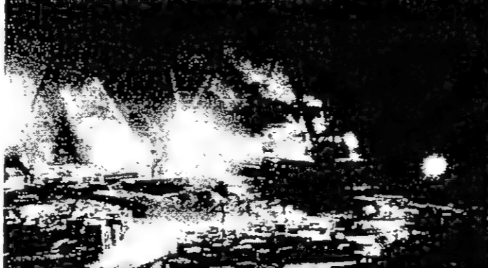
ميناء دوبيكا ... عمل لا ينقطع.